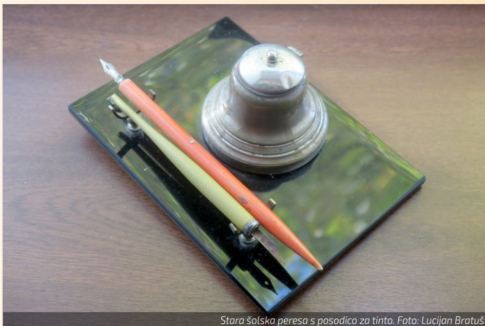
Stara šolska peresa s posodico za tinto.

Vipavski muzej v Kebetovi hiši je bil letos tudi zelo lepo predstavljen na RTV Slovenija v 22. delu dokumentarne serije Mestne promenade 9. 8. 2023. Najprej je prišel na vrsto Vinogradniški muzej v Lanthierijevem gradu, kjer smo slišali znano pesem našega Franceta Prešerna Zdravljica. Uglasbil jo je duhovnik Stanko