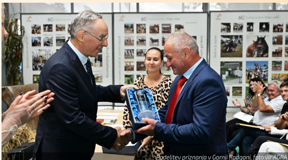
Podelitev priznanja v Gornji Radgoni

»Nikoli si nisem zares predstavljal, da bom nekoč prejel naziv Vinar leta. Zlasti zato, ker je v Sloveniji cela vrsta veliko večjih kleti, kot je naša. Vendar je res, da v vseh 49 letih Odprtega državnega ocenjevanja