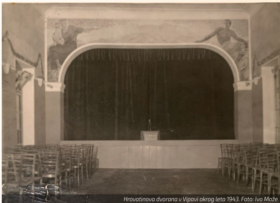
Hrovatinova dvorana v Vipavi okrog leta 1943.

Najprej je na oder te dvorane stopil zbor starejših Vipavcev in je po dolgih letih prepovedi v času fašizma pesem svečano zadonela v slovenskem jeziku. Nato so prišla na oder mlada dekleta v igral-skih kostumih. Ko so dvignili zaveso, se je prikazala izba z različnim pohištvo. Na sredini je bila miza, poleg nje zvrhana košara perila, stolček z likalnikom, ob steni pa je bila omara.