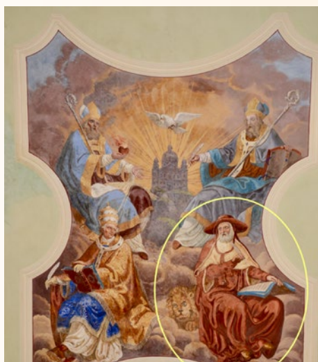
Stropna freska zahodnih cerkvenih očetov pred prezbiterijem v cerkvi Marije Tolažnice žalostnih v Logu (sveti Hieronim označen).

24. 9. (Hieronim goduje 30. 9.). V Župniji Vipava je bila sprejeta odločitev, da bi se letos k tej priljubljeni cerkvi v slikovito naravo Nanosa odpravili peš skupinsko. Od Kampa Tura na Gradišču je zjutraj krenila skupina več kot dvajsetih pohodnikov, med njimi tudi zagnani otroci, ostali smo se pridružili pri Eko koči na Nanosu. Skupaj se nas je preko šestdeset vzpenjalo h končnemu cilju. Pot so brez težav prehodili tudi predšolski otroci.