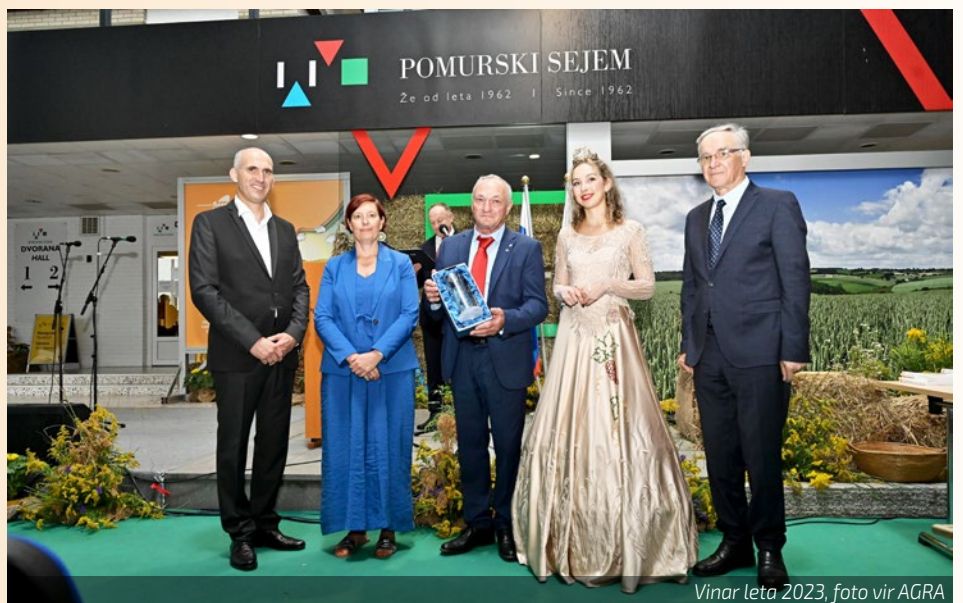
Vinar leta 2023

»Nisem se želel učiti na napakah, zato sem dobro poslušal nasvete strokov-