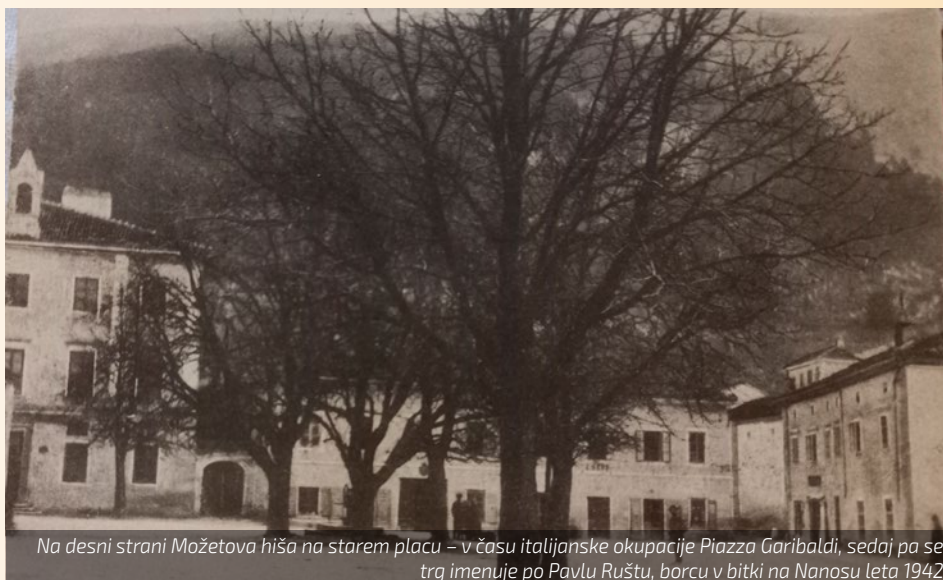
Na desni strani Možetova hiša na starem placu – v času italijanske okupacije Piazza Garibaldi, sedaj pa se trg imenuje po Pavlu Ruštu, borcu v bitki na Nanosu leta 1942

Gledalci v dvorani so bili navdušeni, presenečeni in ganjeni. Po petindvajsetih le-