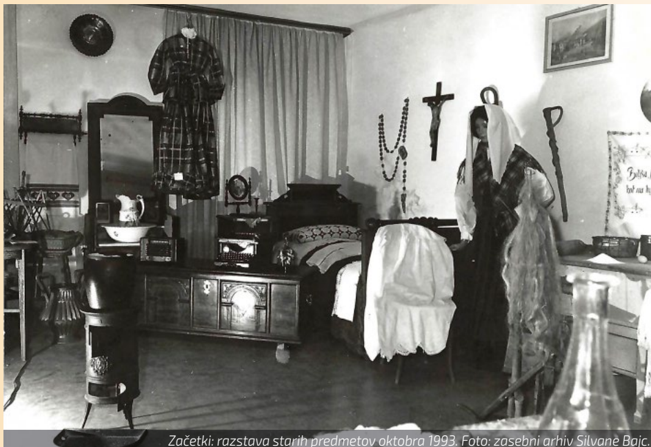
Začetki: razstava starih predmetov oktobra 1993.