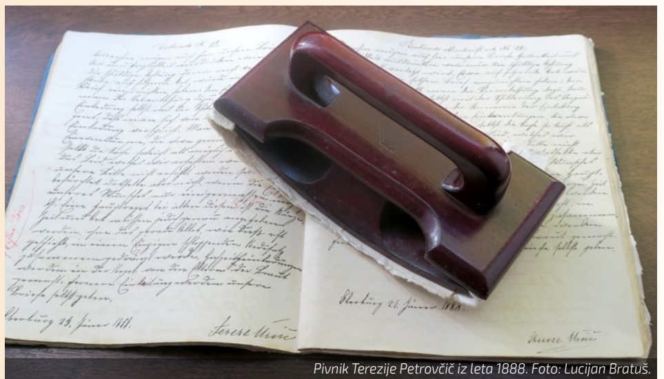
Pivnik Terezije Petrovčič iz leta 1888.

Od razstave starih predmetov do današnjega etnografskega muzeja, ki se sedaj imenuje Vipavska hiša, je minilo natanko 30 let. Naj omenimo čisto na kratko, kako je potekala prehojena pot od prvih začetkov pa do danes. V Vipavskem glasu št.