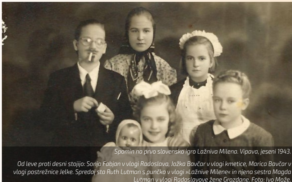
Spomin na prvo slovensko igro Lažniva Milena. Vipava, jeseni 1943.

tih italijanske okupacije naše Primorske je bila to prva igra v slovenskem jeziku v javnem prostoru. Mnogim prisotnim v