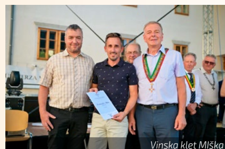
Vinska klet Miška

dali skozi vasi Vrhpolje in Sanabor do Turistične kmetije Abram in tako premagali kar 14,5 km ter se povzpeli za 820 višinskih metrov. Ob tej priložnosti čestitamo vsem, ki so se podali na vzpon.