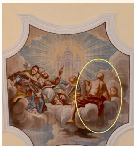
Stropna freska zahodnih cerkvenih očetov nad korom v cerkvi sv. Štefana v Vipavi (sveti Hieronim označen).