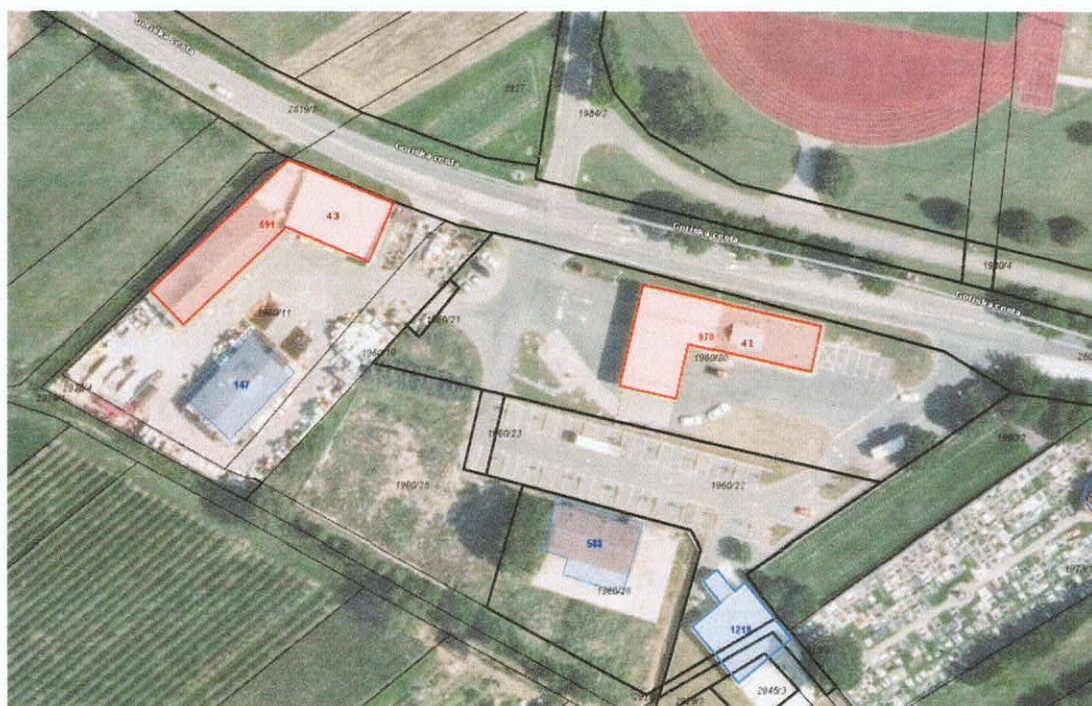
Slika 1: Obdelovano območje se nahaja na zahodnem delu naselja Vipava, v neposredni bližini bencinskega servisa

Objekt se nahaja na parceli 1960/26 k.o. 2401 Vipava, ki je po podrobnejši namenski rabi »gospodarska cona«, delno pa »pokopališče«. Obstoječe stanje predstavlja objekt – bivša Čebelica, ki je trenutno v zapuščenem stanju. Objekt in okolica sta neprimerno vzdrževana ter okoljsko sporna. Rušitev objekta in sanacija okolice pred gradnjo novega objekta je nujna. Objekt ima dostop s severne strani z Goriške ceste, s parkirišča.