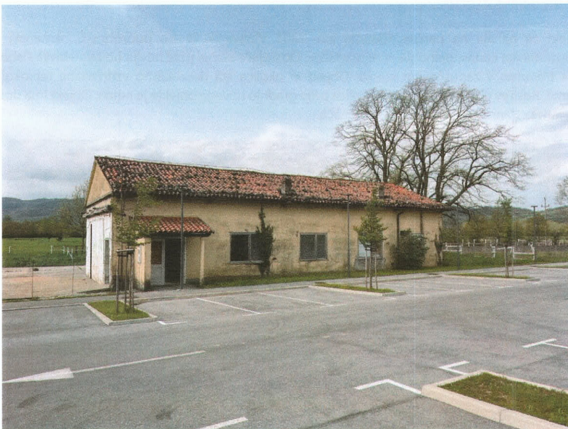
Slika 3: Pogled na obstoječi objekt s parkirišča pod bencinskim servisom