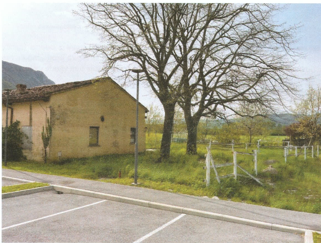
Slika 5: Lokacija predvidenega novega dostopa na zemljišče.