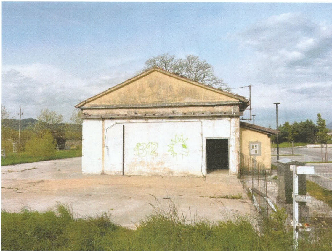
Slika 4: Pogled na objekt s mrliške vežice v bližini